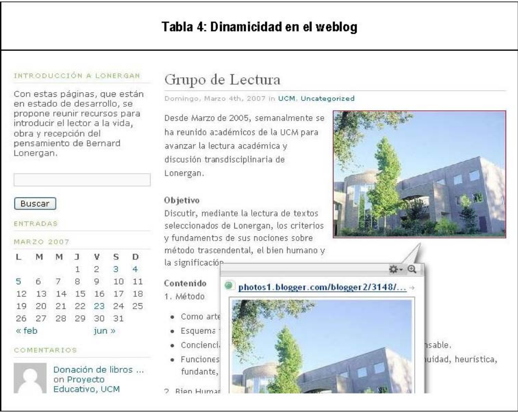
Tabla 4: Dinamicidad en el weblog

Por su parte, en el weblog de la tabla 5 se muestran diferentes elementos que hacen al interfaz, además de dinámico, interactivo.